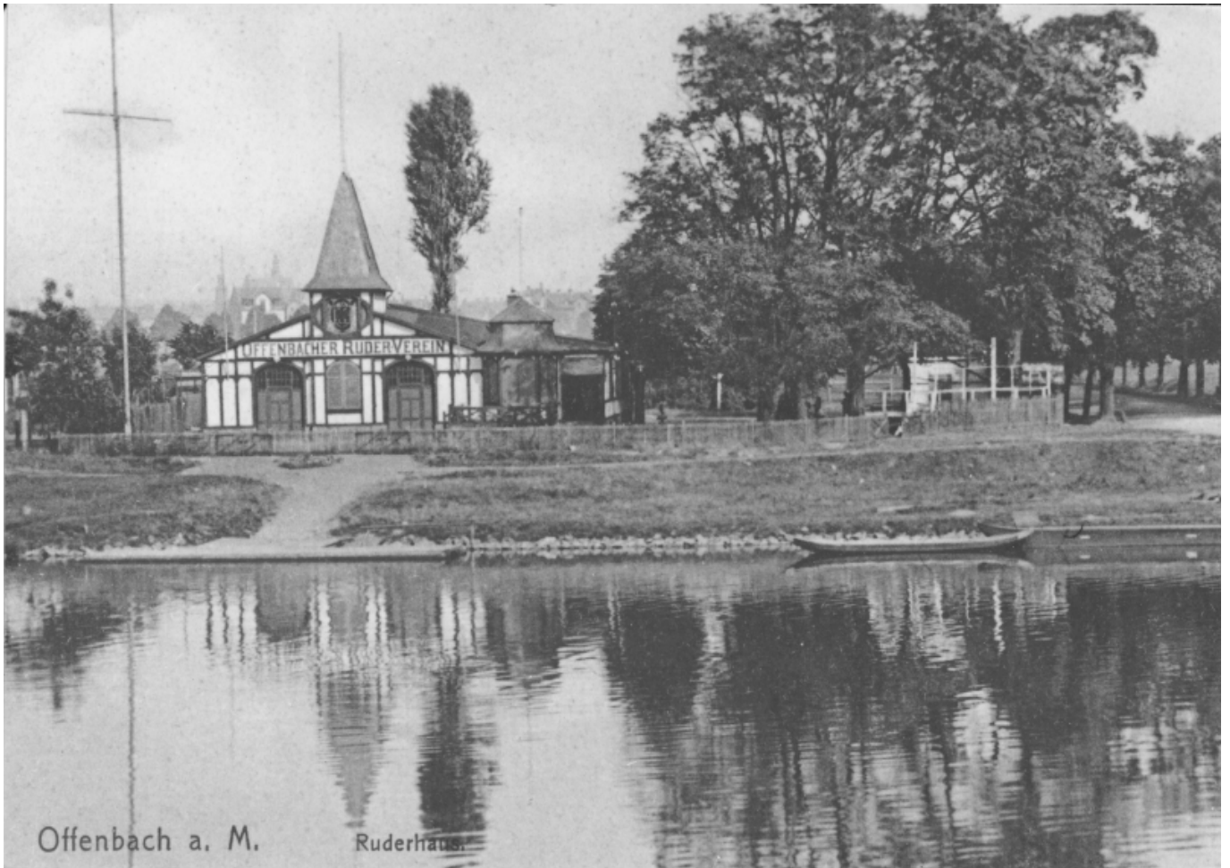
Offenbach a. M.