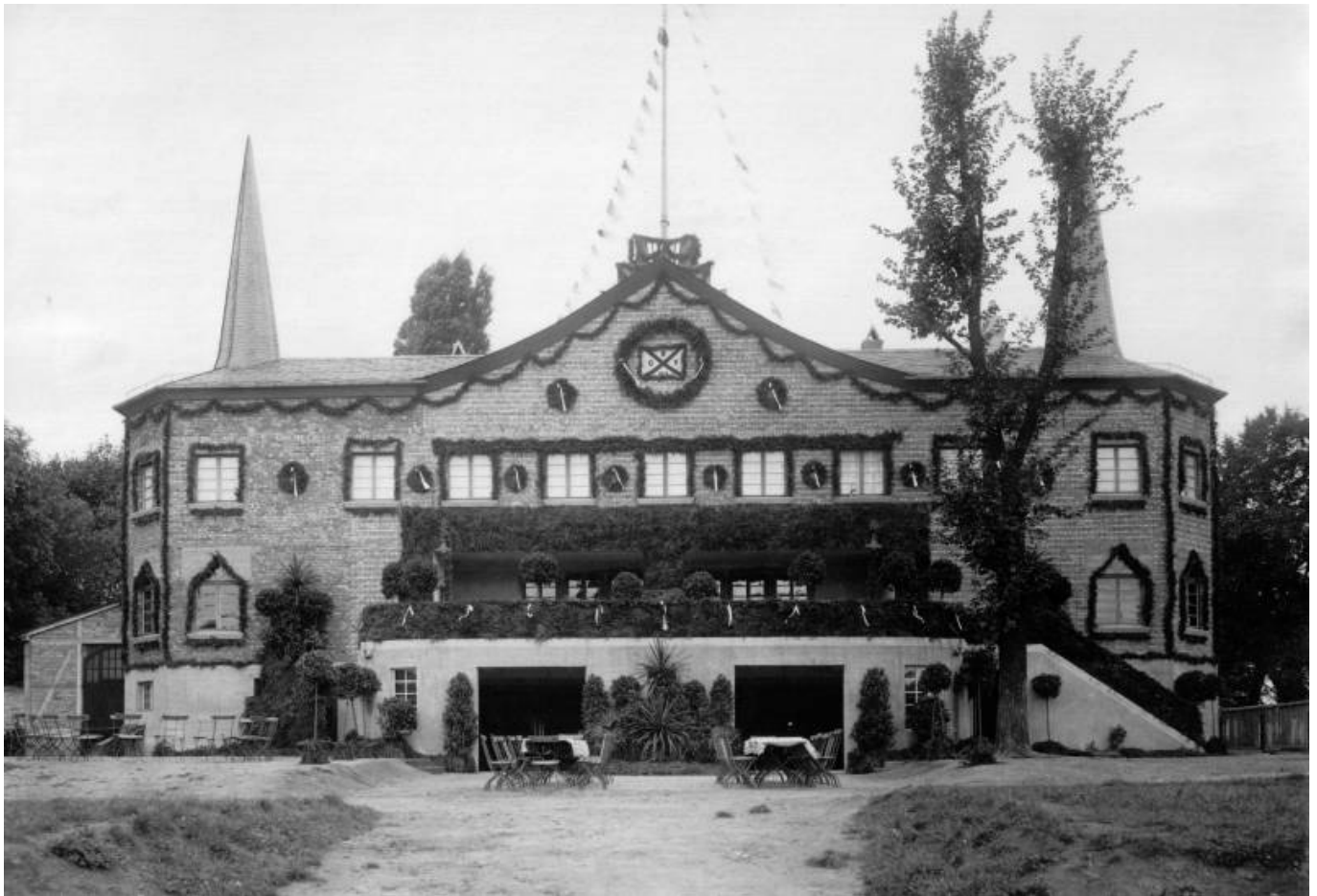
Das Neue Bootshaus am Tag der Einweihung