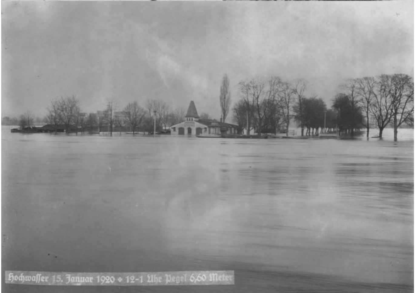
Hochwasser 15. Januar 1920 ♦ 12-1 Uhr Pegel 6,60 Meter