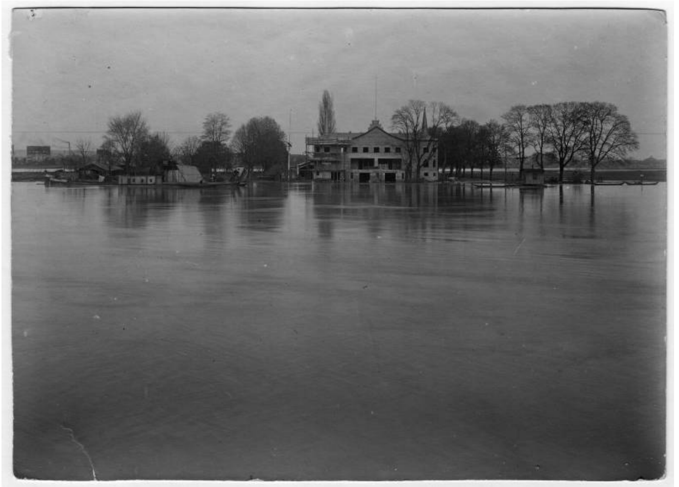
Die erste Bewährungsprobe noch während des Baus